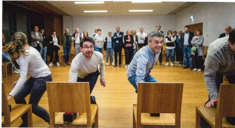
Im Rahmen der Vollversammlung wurde mit vollem Einsatz um Quizpunkte gekämpft

Im Rahmen der diesjährigen Vollversammlung am 27. April, gab es ein besonderes Jubiläum zu feiern: Der Jugenddienst Unterland wird heuer 40 Jahre alt. Als wichtige Fachstelle für Kinder- und Jugendarbeit im Unterland hat sich der Jugenddienst in den letzten 40 Jahren stets weiterentwickelt und seine Tätigkeiten und Wirkungsfelder den sich wandelnden gesellschaftlichen Bedürfnissen angepasst.